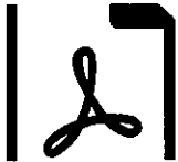
Adresa indic... .pdf 32.1kB

Descărcați toate cele fișierele atașate sub formă de fișier zip